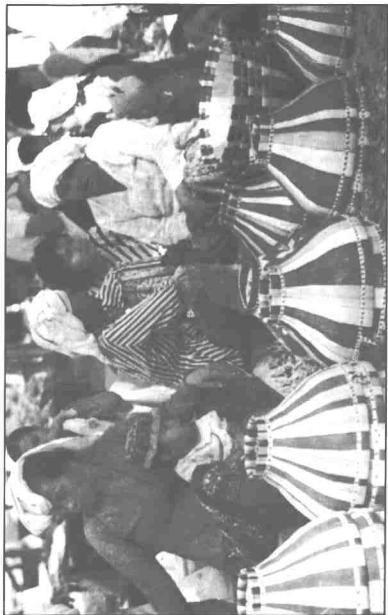
Pasar Tamu di Sabah