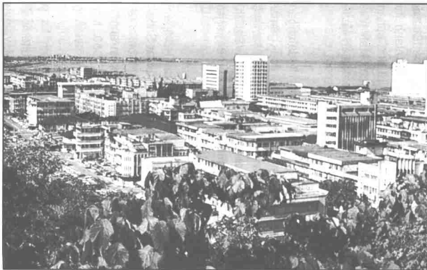
Bandar Kota Kinabalu