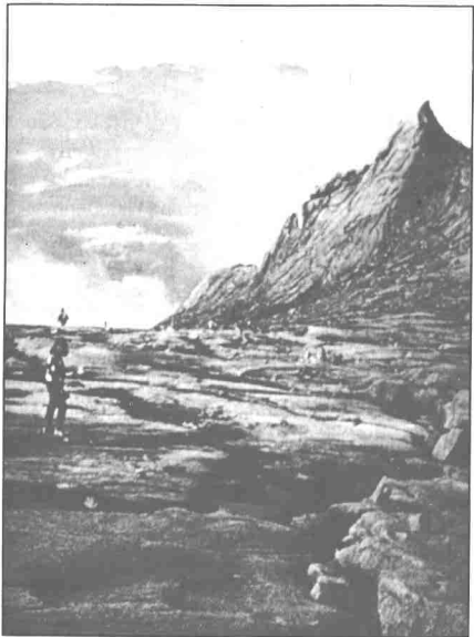
Gunung Kinabalu menjadi kemegahan rakyat Sabah